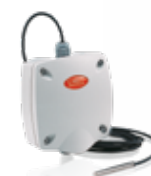
Sondes actives de température